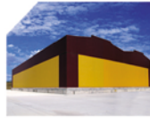
11.500 m2 Gümrüksüz 6.600 m2 Gümrüklü Depolar