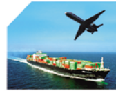
Deniz ve Hava Nakliyede Komple ve Parsiyel Forwarder Hizmeti