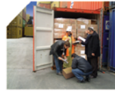
22 İde Gümrük Müşevirliği