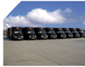
Türkiye Dahilindeki Tüm Adreslere Ulaşım Dağıtım