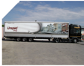
Karayolu Tařımacılık Hizmetleri