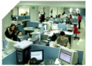
3.500'ü Aşkın Yetişmiş Personel

UNSPED PAKET SERVİSİ KIBRIS ŞTİ.LTD. Taşkınköy Mah.Dr.Fazıl Küçük Bulvarı D469 Lefkoşe